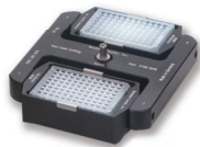
スウィングロータ S6096

最高回転数：18,000 rpm 最大遠心力：29,756 xg 容量：24本×2.0 mL