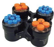
スウィングロータ SX4400 BIO-C パイオセーフティ対応

最高回転数：4,700 rpm 最大遠心力：4,500 xg 容量：16本×50 mL コニカル 36本×15 mL コニカル 4本×400 mL 平底ボトル